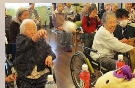
機能訓練やレクリエーションで身体機能の維持を図っていきます。

日常生活で見守りや介護が必要な方は、短期間の宿泊利用ができます。入浴や食事の提供、健康管理などを受けながらお過ごしいただけます。 (対象 要支援1以上の方)