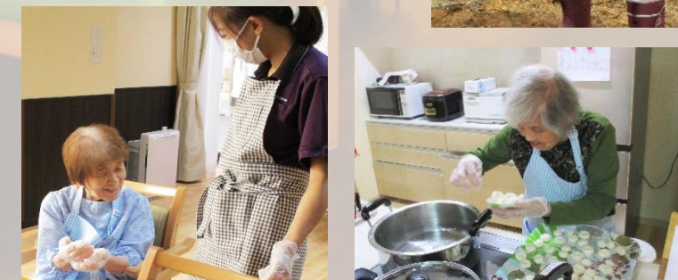
外出や調理の機会を多く設けています。施設内の家庭菜園では、野菜の収穫や草花の成長が楽しめます。