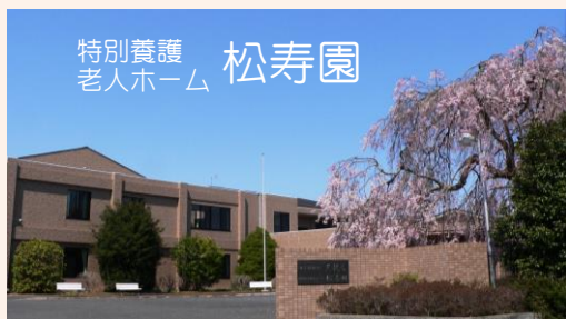
特別養護 老人ホーム 松寿園