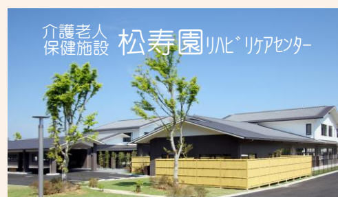
介護老人 保健施設 松寿園リハビリセンター